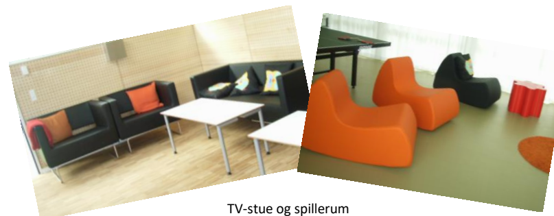
TV-stue og spillerum