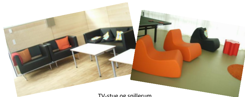
TV-stue og spillerum