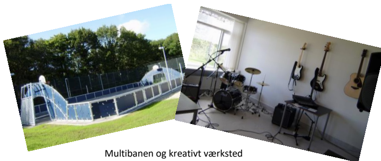
Multibanen og kreativt værksted