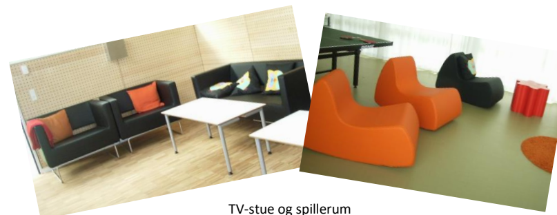
TV-stue og spillerum