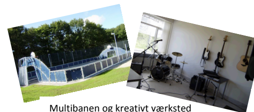
Multibanen og kreativt værksted

Fritiden kan foregå med idræt, spil, kreativt værksted, Play Station, tv og samvær med de andre unge og afdelingens personale. Kompasset har en udendørs boldbane og en sportsbygning, som vi bruger til idræt.