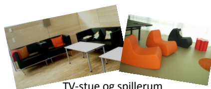
TV-stue og spillerum

Kompasset er en sikret døgninstitution for unge i alderen 15–18 år. Det betyder, at du ikke kan forlade institutionen under opholdet. Vi har 2 afdelinger med plads til 4 unge på hver.