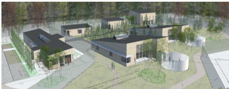
Den Sikrede Institution Kompasset