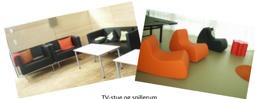
TV-stue og spillerum