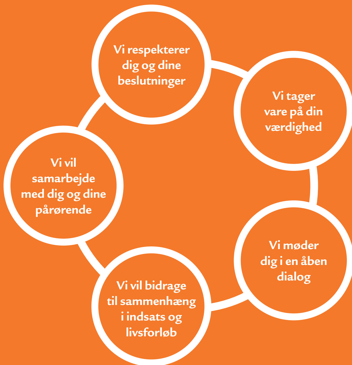
Figur: Speciaalsektorens fem nøgleværdier