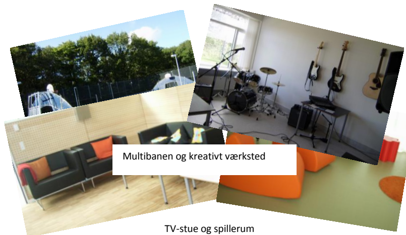
TV-stue og spillerum

Fritiden kan foregå med idræt, spil, bordtennis, Play Station, tv og samvær med de andre unge og afdelingens personale.